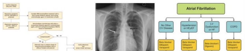
Obstructive sleep apnea and chronic obstructive pulmonary disease overlap syndrome.